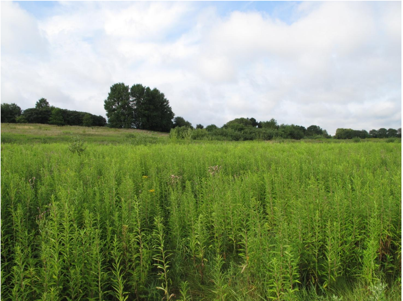
Areal 9 med sildig gyldenris i forgrunden. Bagerst til venstre kan et tørt område, med svag overdrevskarakter anes.

Areal 9 var domineret af høje urter og fremstod som en næringsrig kultureng. Der var et enkelt fugtigt område samt et bakke drag i den sydligste ende, som fremstod tørre og med svage overdrevstegn. Forekomsten af en del småpil og andre små træer tyder på, at området i nær fremtid vil få en mere kratpræget karakter. Der var ingen tegn på pleje, udover at der blev bekæmpet kæmpe bjørneklo. Plejen af området er en efterårsslåning hvert 4. år for at hindre området i at springe i skov. Området ville have gavn af en reduktion af næringsstofferne. Det vil være oplagt at slå området, for efterfølgende at fjerne biomassen. Dette ville forhindre, at små træer vokser op, udpine jorden og samtidigt virke som bekæmpelse af gyldenrispopulationerne.