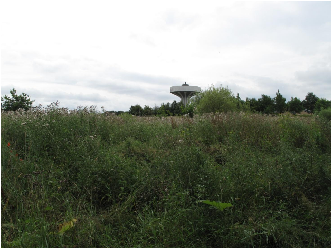
14. Enkelte blade af kæmpe bjørneklo stikker op iblandt det kraftige urtedække.

Arealet er af beskeden størrelse og befinder sig i områdets sydvestlige hjørne. Midt på området er der en dam. Området var domineret af høje urter og græsser. Der var ingen tegn på drift, og der fandtes spredte buske og træer. Plejen af området er en efterårsslåning hvert 4. år for at hindre området i at springe i skov. Hvis området ønskes bevaret som en lysåben habitat, bør det inddrages enten som græsningsareal eller benyttes til høslæt. Med øje for høslæts større effektivitet angående næringsstoffjernelse anbefaler vi, at man indleder med høslæt i en eller anden form over en årrække.