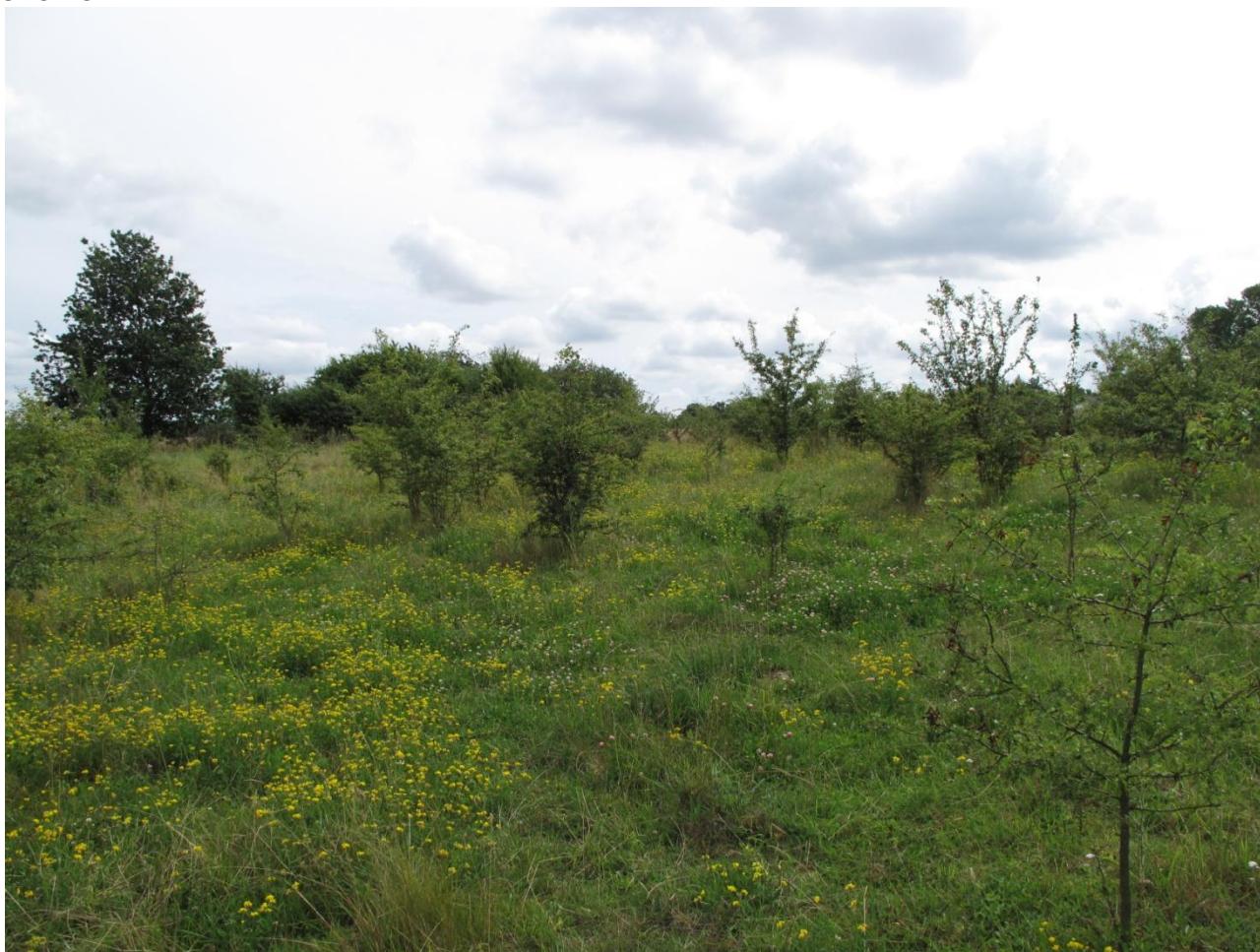
15B. Begyndende dominans af engriflet tjørn. Alsikekløver og alm. kællingetand i forgrunden.

Lokaliteten fremstår som en kultureng, men med begyndende tilgroning. Størstedelen af området er præget af engriflet hvidtjørn. Om end planterne endnu kun er i buskstadiet vil det kun vare få år, førend området antager skovlignede karakter. De engriflede hvidtjørne er mange steder 1½- 2 meter i højden. Engens nordvestlige ende er endnu ikke sprunget i krat, men er til gengæld præget af mindre områder med sildig gyldenris. Folden sommerafgræsses af Hjortespring Naturplejerforening uden tilskuds fodring. Folden har normalt blandet afgræsning med får og kvæg, men fårene er fjernet i 2010 pga. parasitter. Området er heget ind og benyttes til græsning. Der har kun været begrænset græsning med kvæg på området henover sommeren, da de mange tjørn giver problemer. Hvis man ønsker at bibeholde græsning samt områdets åbne karakter, skal man fjerne tjørnen. Dette kan kun ske effektivt ved menneskelige indgreb. Evt. kunne enkelte træer tillades at vokse sig større, så disse kunne benyttes som læ og skyggesteder for kreaturerne. Hvis man sørger for, at afgræsningen foregår hver sommer, burde dette være nok til at bekæmpe gyldenrisen på området. Der blev observeret eng-brandbæger på området. Planten er giftig for husdyr.