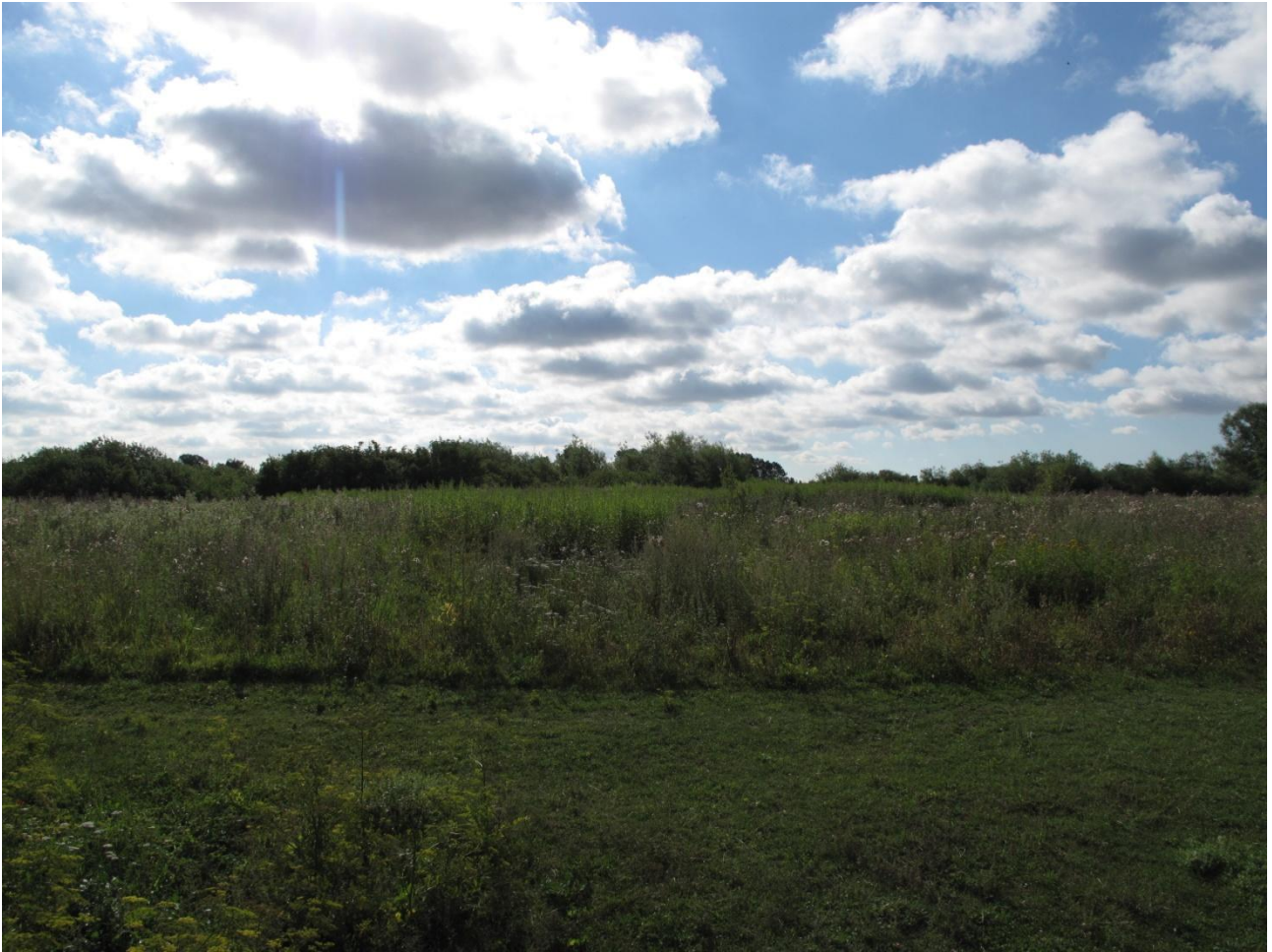
Areal 7A med slået område i forgrunden og sildig gyldenris i baggrunden.

Området består af den vestlige del af areal 7. Arealet indeholder fem søer og et moseområde lidt vest for areal 11A. Området må betegnes som kulturreng og var domineret af høje urter, heriblandt store populationer af sildig gyldenris, men også lodden dueurt, pastinak, kruset tidsel og agertidsel var at finde i store mængder. Der er tidligere rapporteret om gøgeurter på denne lokalitet, men trods en større eftersøgning blev ingen fundet. Udover slåning omkring et opholdssted ved en af søerne blev der ikke set tegn på plejeforanstaltninger. Plejen af området er en efterårsslåning hvert 4. år for at hindre området i at springe i skov. Området vil egne sig til høslæt, da dette ville virke både som en bekæmpelse af sildig gyldenris, og en fjernelse af næringsstoffer ville give en mere righoldig flora og fauna.