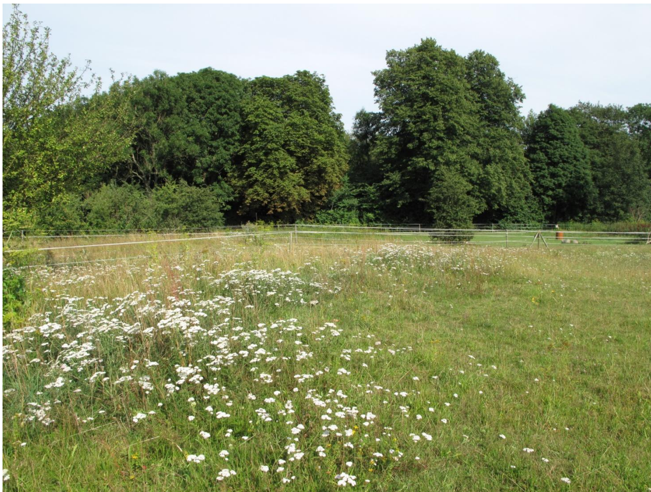
Flere forskellige folde. Forskellen i græsningstryk kan anes på planternes forskellige højder i de enkelte folde.

Den nordlige del af 6A var en kultureng med spredt overdrevsvegetation. Området var delt op i flere folde. I hver fold havde planterne forskellig højde beroende på, hvor ofte der blev græsset, og på hvornår der sidst var blevet græsset. Der var en del træer i området, om end det ikke nærmede sig skovlignende tilstande. De fleste af træerne var frugttræer. Der var nogle steder spor efter slåning med maskine måske en stor græsslåmaskine. Antallet af positivarter for overdrev var ganske højt, men taget arealets beskaffenhed i betragtning, behøver området pleje for at kunne opnå en bedre naturtilstand. Et af problemerne er, at heste ikke benyttes til føde. Derved bliver der ikke fjernet nogen næringsstoffer, idet der ikke fjernes nogen biomasse i form af kød. Der græsses ganske ekstensivt i området, hvilket gør, at dele af helområdet 6A er sprunget i skov. En driftsændring ville hjælpe på floraen i området. Vi forslår, at man som i 6B inddrager noget af området til høslæt. Hvis man så skifter hvert år imellem områder med græsning og høslæt, får man fjernet store dele af næringsstofferne, man får øget græsningstrykket og desuden får man forhindret yderligere opvækst af træer. I den sydlige ende var der en stor bestand af rabarber.