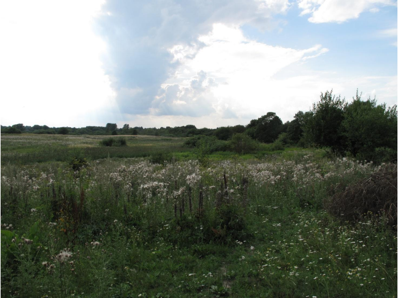
Et vue ud over vinterfolden.

Område 6A vinterfold bar i høj grad præg af mangebladet lupin, men også en del andre invasive arter og havearter fandtes i området. Enkelte træer stod spredt, men der var ikke tegn på, at området var ved at springe i skov. En indsats overfor mangebladet lupin og hybridpileurt vil være ønskelig. Mangebladet lupin bekæmpes ved slåning to gange om året. Første gang inden blomstring (maj-juni) og anden slåning to måneder efter den første. Efter 3-5 år kan man nøjes med at slå en enkelt gang inden blomstringen /4/.