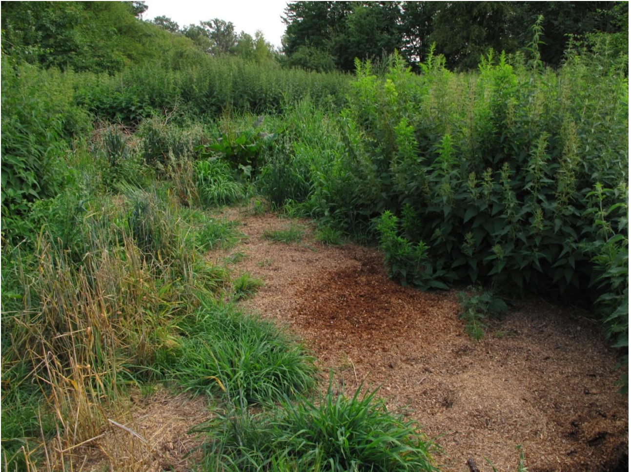
Området ved møddingen. Næringskrævende urter står tæt.

Området var præget af ældre skov med en lille mose samt en mødding. Der fandtes 14 forskellige buske og træer. Underskoven bar ikke præg af skovbundsplanter, om end enkelte arter såsom skovsalat og plettet arum stod hist og her. Området kræver ingen pleje. Der er en mødding på området, og man bør tage stilling til, om den skal fjernes eller udstyres med fast bund.