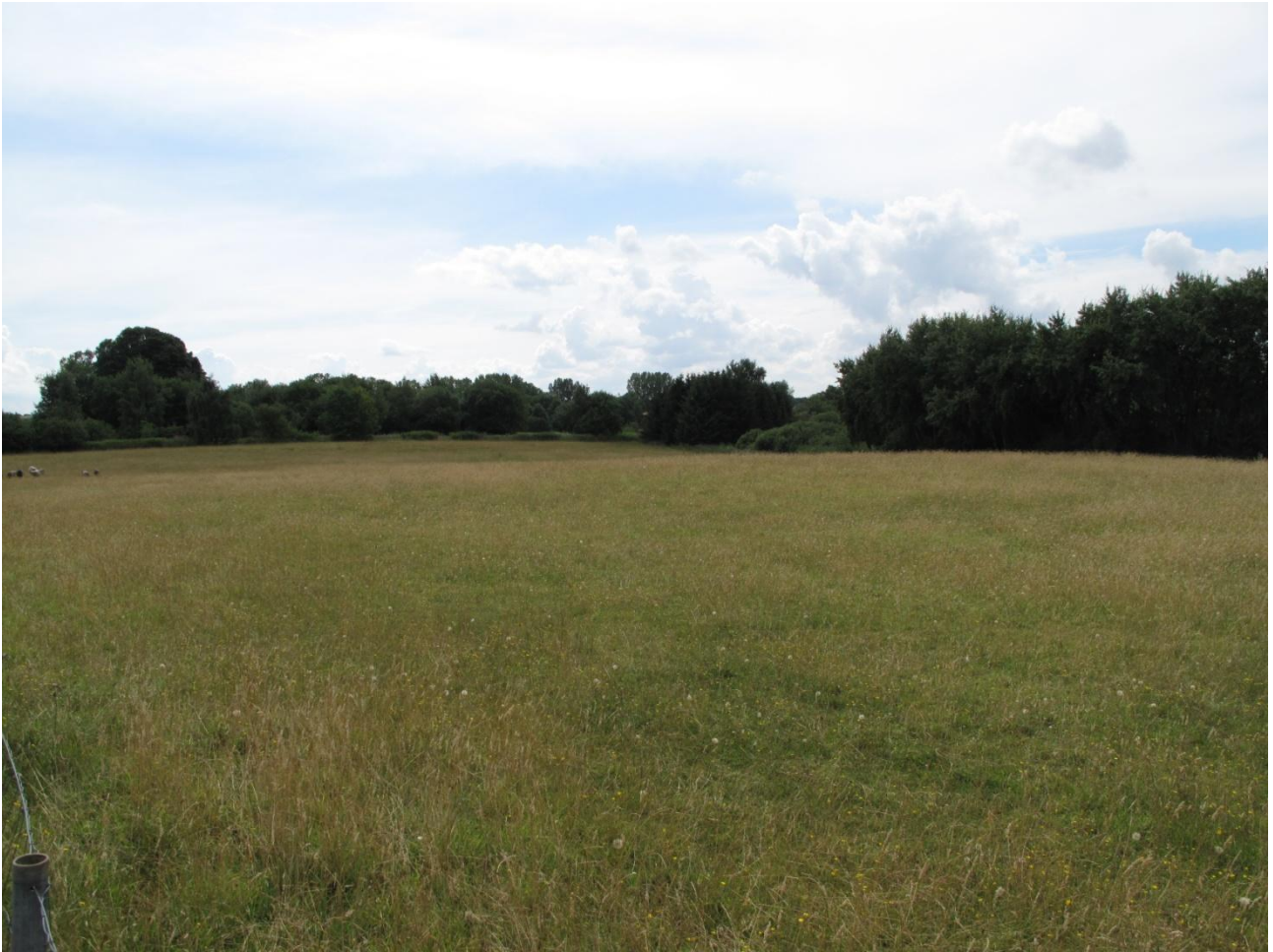
Fårefolden. Det tørre område.

Arealet består af en lidt fugtig kultureng på arealets vestlige side og et tørt overdrevsområde på den østlige side. Området bar præg af intensiv fåregræsning og besætningen var tilpas stor til, at favoriseringen af urter ikke slog igennem. Således var områdets overdrevsdel nok den fineste del af hele det undersøgte område omkring Kildegården. Yderligere plejetiltag lader ikke til at være nødvendige. Dog kunne det være interessant, at vide i hvilken grad der benyttes tilskuds fodring.