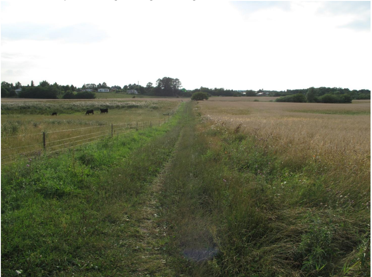
Sti ved nordsiden af 5A.

Hele området er sammenknyttet via et udbredt stisystem. Stisystemet plejes ved hjælp af slåning, men der er ikke nogen bortfjernelse af det afskårne materiale. Man kunne forvente en variation imellem de forskellige stier, afhængigt af hvilke arealer stien lå nær. Stiernes flora var dog langt mere påvirket af de umiddelbare jordbundsforhold og af det faktum, at de blev slået. Således var det de samme arter, som dominerede på hele stisystemet, dog med afbrud, hvis stien lå nær et vandhul og således havde mere fugtig jordbund. Derudover var der arter, som havde en mere klumpet fordeling, men uden nogen åbenlys sammenhæng med områderne. Dette gør dog ikke, at stisystemernes potentiale som spredningskorridorer forsvinder. Takket være den megen færdsel vil der blive transporteret mange frø langs stierne og imellem områderne.