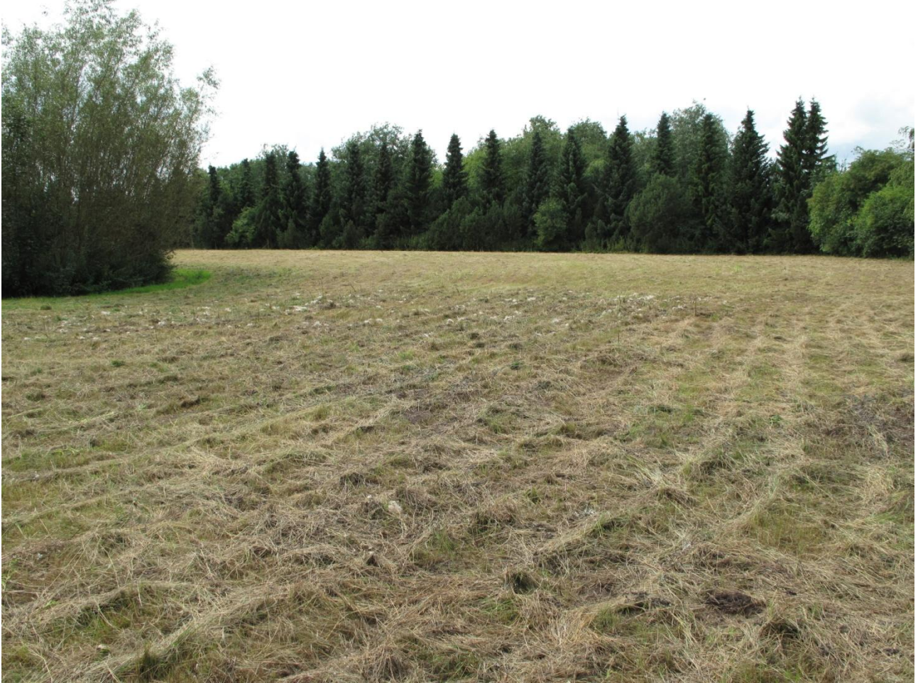
Området med høslæt.

Området var blevet slået få dage inden undersøgelsen, men havde tidligere fremstået med mange høje græsser og urter. Der er tilsyneladende ikke brug for plejeindgreb eller ændringer i driften. Det kunne være interessant at vide om lodsejeren er interesseret i at lave høslæt to gange om året.