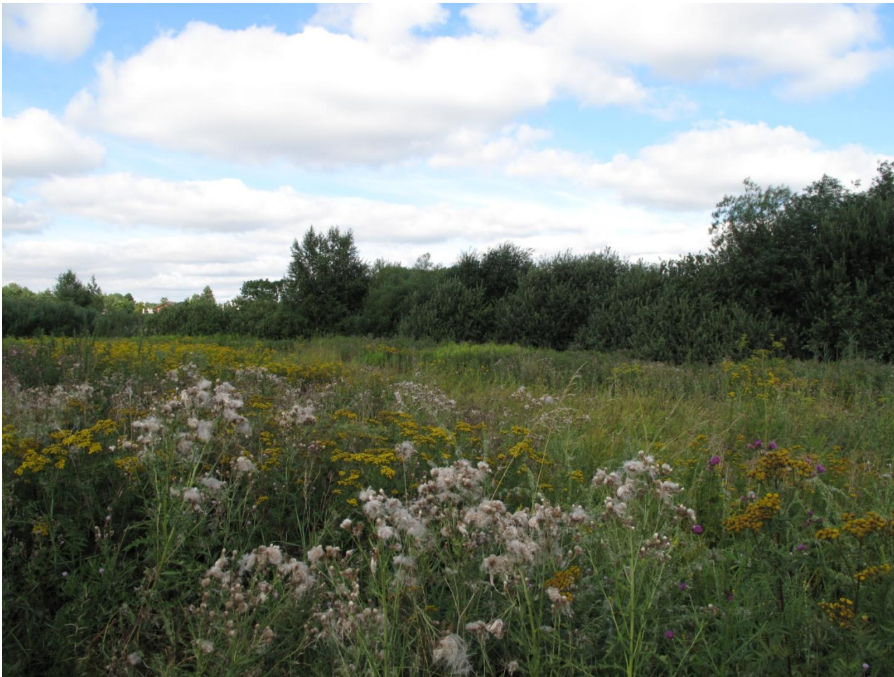
7B. Område med høje urter i forgrunden. Bagved er der et område med lavere overdrevsarter.

Et lille område i mellem to søer i den sydvestlige del af areal 7. Området havde en større bestand af hulkravet kodrivere, men også andre overdrevsarter såsom vellugtende gulaks, alm. kællingetand, dunet vejbred, liden skjaller, musevikke, gul snerre og ikke mindst hjertegræs. Dette lille område indeholder nok den største tæthed af overdrevsarter, men desværre er området ved at vokse til. Mere næringskrævende urter er ved at skygge de mindre overdrevsarter bort. Dette område vil kunne virke som en spredningskilde til de omgivende arealer og bør derfor slås nænsomt. Plejen af området er en efterårsslåning hvert 4. år for at hindre området i at springe i skov.