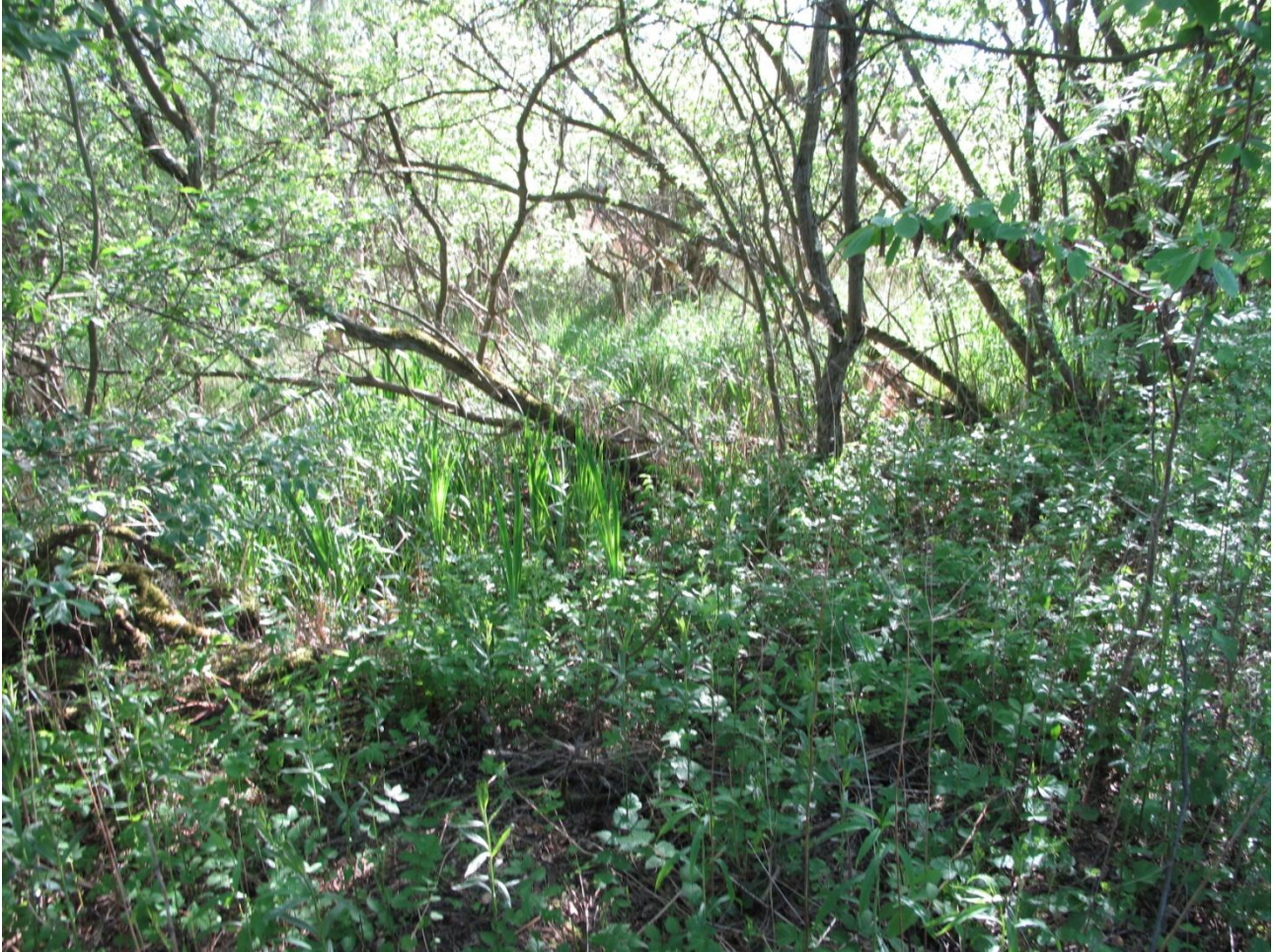
11A. Lysåben og fugtig skovbund.

Arealet fremstår som et tæt krat med fugtig bund. Der er vandhuller på arealet, og den nordlige side afgrænses af Tipperup å. Den dominerende vækst er pil, men også andre træer og buske præger området. Der er mange forskellige plantehabitater varierende fra åbent vand til områder, som næppe bliver oversvømmet ret ofte. Der er også en stor variation i den tilgængelige lysmængde, graderende fra åbent kronedække til tæt kronedække. Der er en del positive mosearter, bl.a. blåtop, tormentil, vellugtende gulaks, kragefod, dyndpadderok, og de mange indikatorarter understreger den gode naturtilstand.