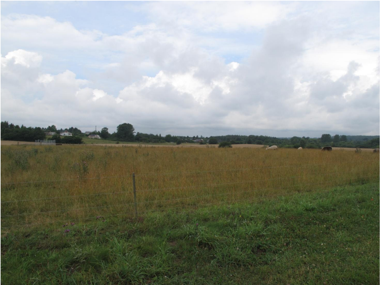
5A. Fåregræsset fold. Læg mærke til mængden af græsser.

Området består af to folde der løber parallelt med hinanden. Den østlige fold helårsgræsses med tilskuds fodring af får hørende til Kildegården. Den vestlige sommerafgræsses uden tilskuds fodring af kvæg hørende til Hjortespring Naturplejeforening. Den vestlige fold har normalt blandet afgræsning med får og kvæg, men fårene er fjernet i 2010 pga. parasitter.