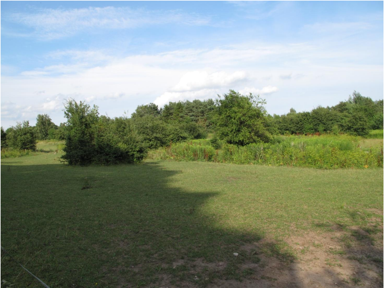
Skovområdet ligger bag området med sildig gyldenris.

Den østlige del af 6A var til dels dækket af skov. Skoven var en blandingskov bestående bl.a. af ahorn, alm. eg alm. røn, bævreasp og dunbirk. I alt fandtes 16 forskellige arter af træer. Der var spredte hestestier i området, men generelt var der ikke mange tegn på færdsel i dette område. Vegetationen bestod hovedsageligt af arter fra de omgivende enge og var ikke som sådan præget af skovbundsplanter. Ønsker man at bevare skoven vil det ikke være nødvendigt med et indgreb. Dette er nok den bedste tilgang, da det vil kræve et større indgreb at ændre dette område tilbage til eng/overdrev. Der var sildig gyldenris i den nordlige del af området.