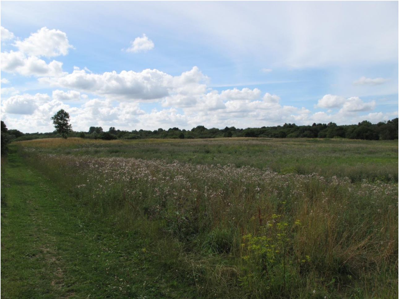
7C, med sti-område i forgrunden.

Området, der dækker den østlige del af areal 7, indeholder en enkelt sø. Området er som areal 7A en kultureng domineret af høje urter. Området er dog noget mere artsfattigt, hvilket beror på, at området er noget mere homogent end 7A. Bortset fra, at der ved den sidste undersøgelse i august var slået i dele af området med en form for græsslåmaskine, blev der ikke set tegn på plejeforanstaltninger. Plejen af området er en efterårsslåning hvert 4. år for at hindre området i at springe i skov. Området vil ligesom område 7A være velegnet til høslæt.