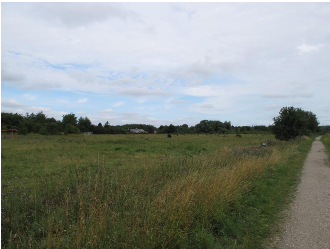
Område 15A med græssende kvæg. I midten af billedet ses det fugtige område.

Området består af to folde, som sommerafgræsses af dyr fra Hjortespring Naturplejerforening uden tilskudsfordring. Folden har normalt blandet afgræsning med får og kvæg, men fårene er fjernet i 2010 pga. parasitter. I midten af området er der et fugtigt område, som hovedsageligt er præget af lysesiv. I den sydlige del af området er der en bakke, som grænser op til et villakvarter. Området er præget af kvæggræsning, med tråd, søleplads, begyndende stidannelse på den sydlige bakke og tydelig tuedannelse især på de mere fugtige steder. Området fremstår som kulturreng med begyndende overdrevskaracter, og enkelte planter såsom håret høgeurt, hulkravet kodriver og alm. brunelle bekræfter overdrevskaracteren. Græsningstrykket virker passende, og fortsætter man plejen som hidtidigt, burde det langsomt forstærke overdrevskaracteren. Man bør dog holde øje med begyndende tilgroning af træer og buske. Dette skal bekæmpes enten manuelt eller ved at skifte imellem kvæg og får/geder.