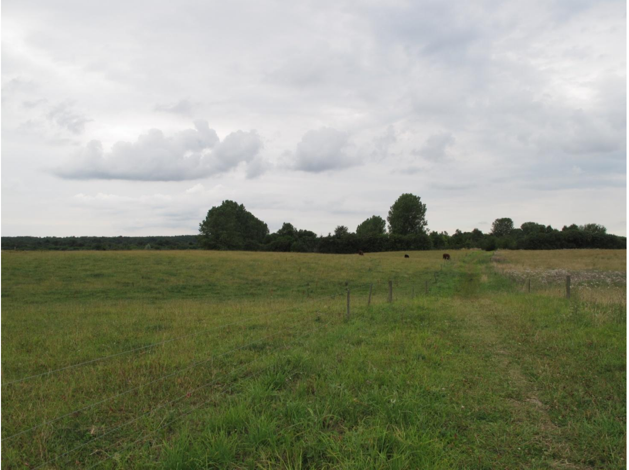
5. Kvæggæsset fold til venstre og fårefold til højre.

Området kan opdeles i to delområder, der plejes forskelligt. Øst for den nord-sydgående sti afgræsses folden af får, mens der på den vestlige side afgræsses af kvæg. Den østlige fold er domineret af græsser, mens den vestlige del præges af urter, såsom rød og hvid kløver. Begge områder er kulturrenge. Der ligger desuden en dam på den vestlige del. Dammen går ofte over sine bredder, og dele af dens sydside går derfor mere over i en fugtig eng. Plejen af området lader til at være passende, om end et enkelt får eller to måske kunne bruges på den vestlige side. Der tilskudsfordres da dyrene går der hele året. Det blev konstateret, at forbigående fodrede dyrene. Dette burde der nok skiltes imod. For at mindske tilskudsfordringen bør belægningen om vinteren sænkes.